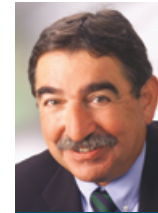
Univ.-Prof. Dr. Walter Hruby

Gefäßkrankungen sind bedeutsame Volkskrankheiten und unzweifelhaft die häufigsten Verursacher von Krankheit und Tod. Der Science Summit Volks Gesundheit – Gefäßkrankungen beschäftigt sich mit den nicht koronaren Gefäßkrankungen wie cerebraler Insult, Thrombosen und Embolien der großen Gefäße, sowie der PAVK. Die aktualisierten Konzepte der Notfalltherapie und -behandlung in Österreich im Zusammenspiel mit der modernen Bildgebung und der röntgenunterstützten Intervention werden vorgestellt. Neue Erkenntnisse und Strategien in der Prävention und Langzeitbehandlung von Gefäßkrankungen sind ebenso Thema wie aktualisierte Richtlinien der metabolischen Beeinflussung (Blutzucker und Lipide), Management des Blutdruckes und der Blutgerinnung in der Sekundärprophylaxe von Gefäßkrankungen. Ziel ist es ein praxisrelevantes Update vermittelt von Top-Expertinnen und Top-Experten zu präsentieren. Neben den Basis-Vorträgen, dienen Fallbeispiele zur Wissensvertiefung. Um die Relevanz der Veranstaltung zu testen erlauben wir uns Ihnen am Ende der Veranstaltung Fragen zu den einzelnen Themenblöcken zu stellen. Selbstverständlich wird Ihnen auch ausreichend Platz für Feedback eingeräumt. Wir hoffen, dass Sie dieses Format anspricht und würden uns freuen Sie als Gast begrüßen zu dürfen.